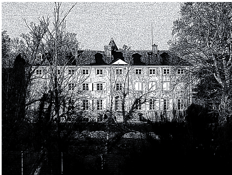
Le château de Bernadets

Le Projet d'Aménagement et de Développement Durable P.A.D.D. est traité à l'article L151-5 du Code de l'Urbanisme.